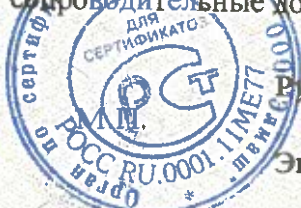
Схема сертификации № 3

Знак соответствия по ГОСТ Р 50460-92 наносится на изделие и на товарно-сопроводительные документы